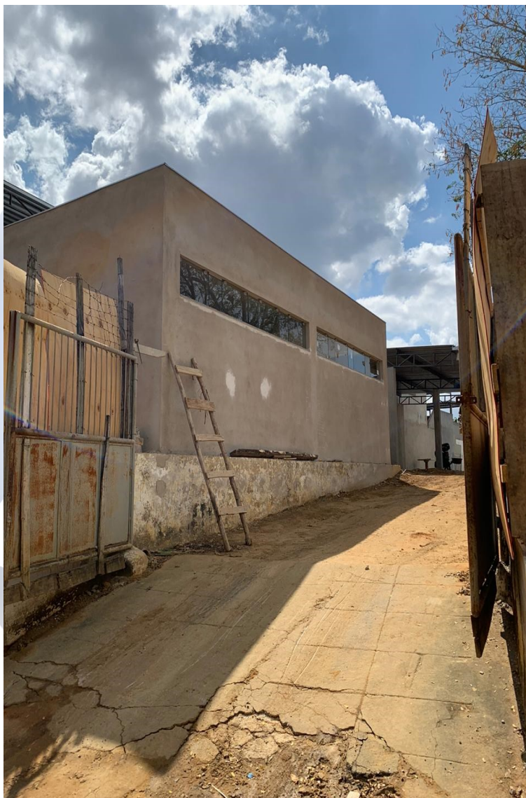
Foto 11: Almojarifado emboçado e instalação de janelas de alumínio maxim-ar.