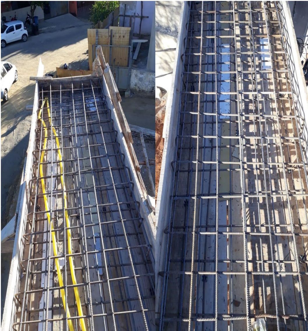
Foto 6 e 7: Montagem das ferragens e passagem dos eletrodutos para concretagem da estrutura de sustentação do brise de estrutura metálica.