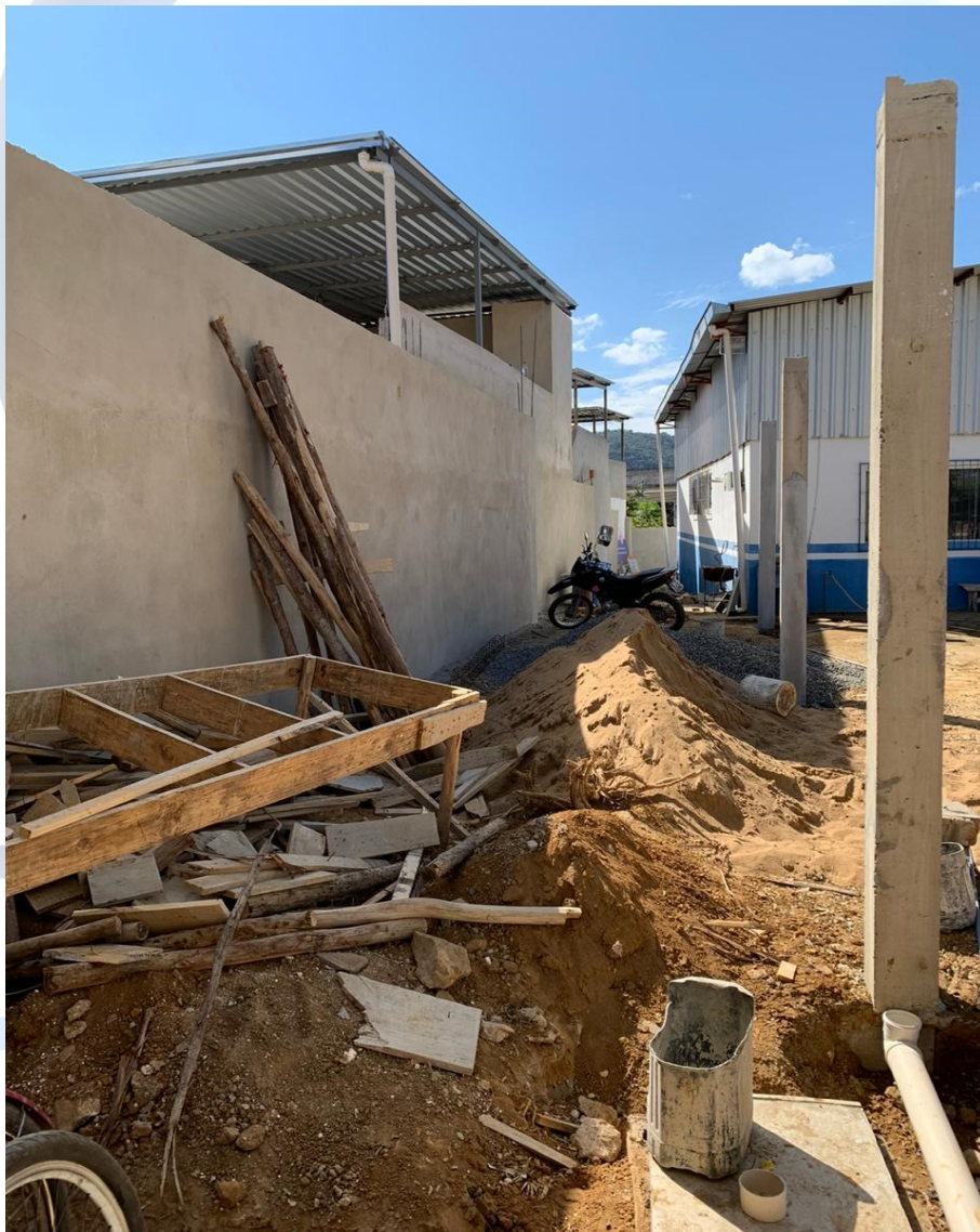
Foto 1: Pilares do estacionamento pronto para receber a cobertura metálica.

2ª Etapa: Concretagem dos pilares do estacionamento, instalação da estrutura metálica do estacionamento, emboço do muro de divisa e montagem da estrutura para recebimento do brise metálico.