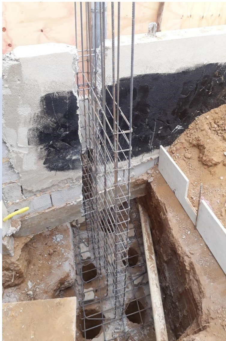
Foto 3: Montagem das ferragens dos pilares e bloco de fundação da estrutura que sustentará o brise metálico.