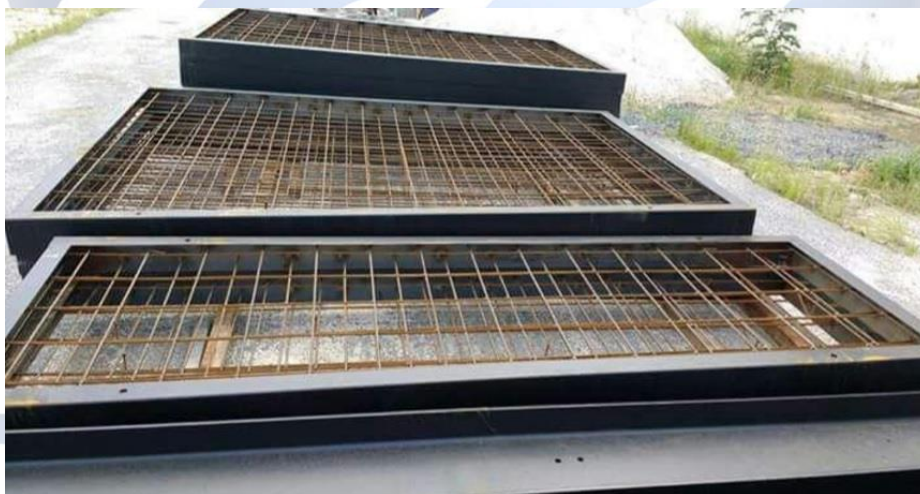
Figura 01 – Modelo de Estrutura Malha de Ferragens para Placa de Concreto Armado.