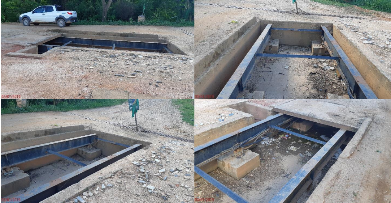
Figura 02 – Estrutura de Aço e Local da Antiga Balança